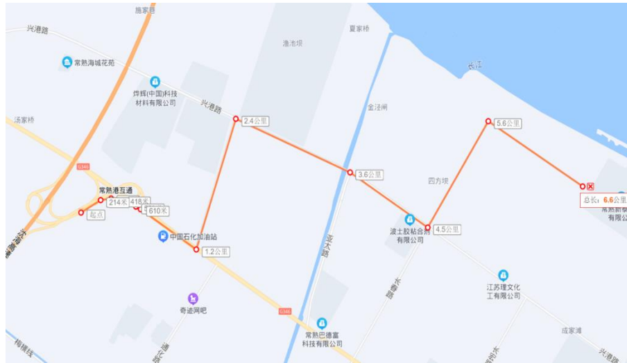
常熟港互通高速至理文化工線路圖