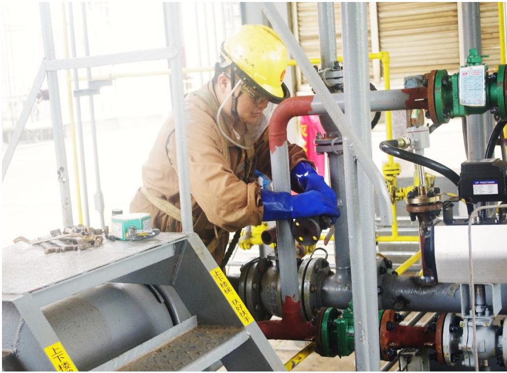
CMS 車間氯甲烷壓縮機保養