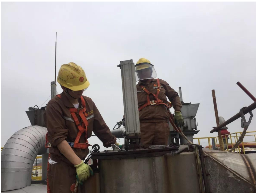
雙氧水尾氣機組頂部更換活性炭纖維作業

6 月 14 日晚，燒鹼二期順利開車，預示著長達 12 天的檢修任務圓滿完成，我們堅信只要付出努力一定可以成為更好的自己，我們也堅信有我們在理文化工一定會越來越好！